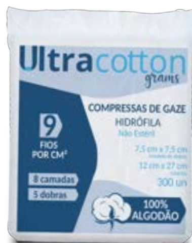
Compressa de Gaze Ultracotton Grams 7,5 cm x 7,5 cm (Medida aberta 12 cm x 27 cm)