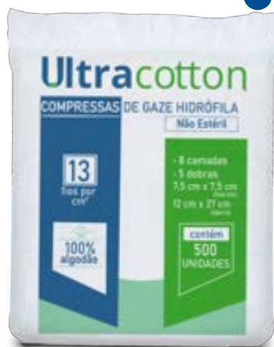
Compressa de Gaze Ultracotton 7,5 cm x 7,5 cm c/ 500 unidades (Medida aberta 12 cm x 27 cm)