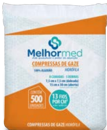
Compressa de Gaze Melhormed 7,5 cm x 7,5 cm c/ 500 unidades (Medida aberta 15 cm x 30 cm)